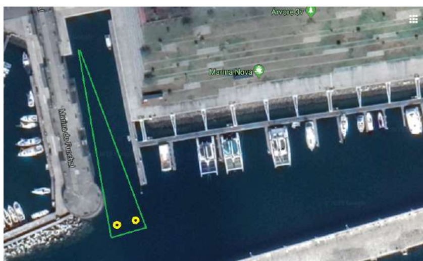
2. Mapa da prova complementar de 200m metros